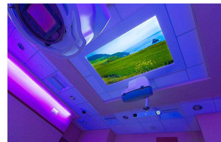
Proyector de Imágenes